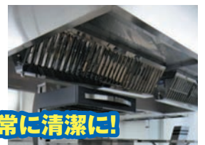
厨房設備は常に清潔に!

清掃、必要な点検及び整備など厨房設備の維持管理は「火災予防条例」で義務づけられています。