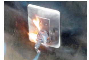
トラッキング火災の様子。

コンセントに差込プラグを長期間差し込んだ状態にしておくと、コンセントと差込プラグの間にほこり等が付着し、付着したほこり等に湿気が帯び、通電することにより火災になることがあります（トラッキング火災）。