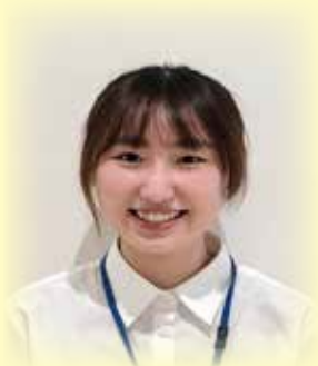
介護保険課認定係在籍 (令和2年度採用)