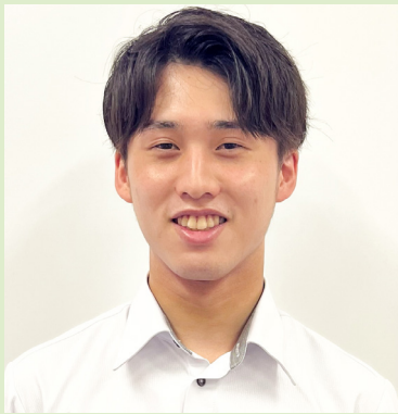
総務課在籍 (令和3年度採用)